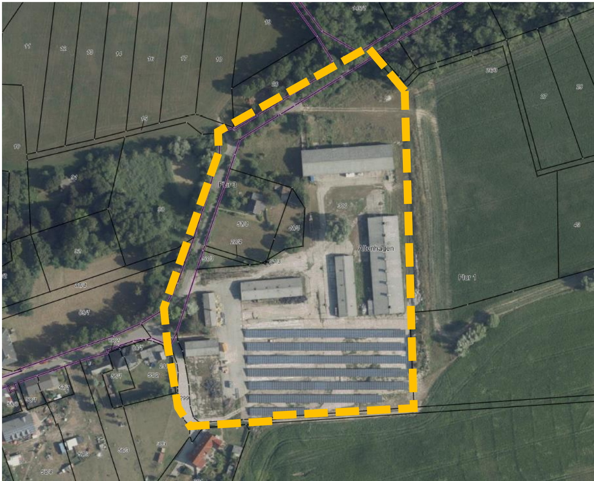
Abb. 1: Geltungsbereich des Bebauungsplanes Nr. 18 im Luftbild, © GeoBasis DE/M-V 2022.