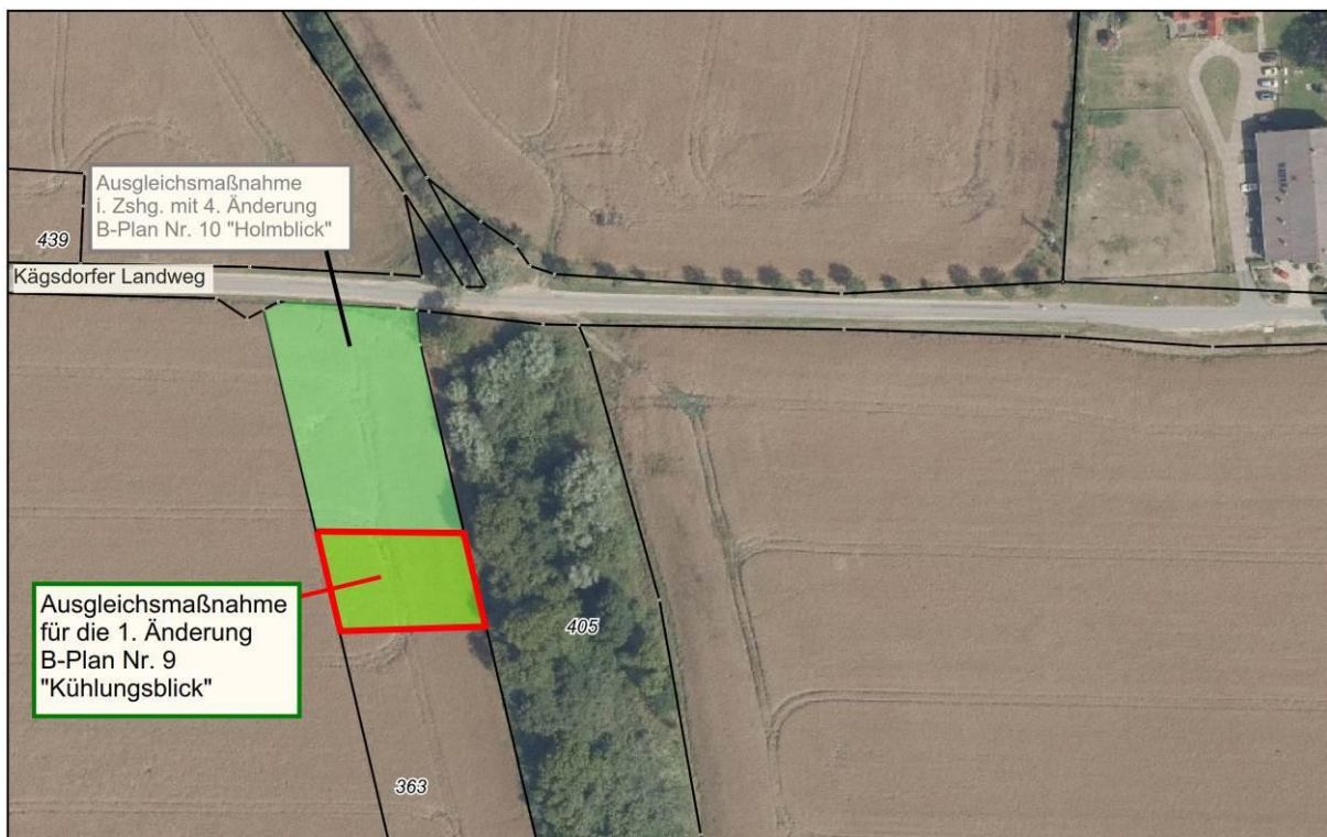
Abb. 1: Umgrenzung der Fläche für die naturschutzfachliche Kompensation, ohne Maßstab; Luftbild © GeoBasis DE/M-V 2022 mit eigener Bearbeitung