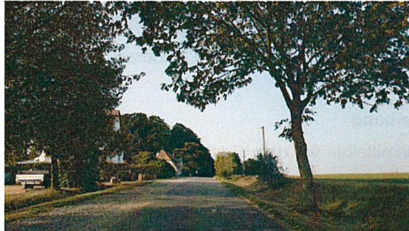
Blick in Richtung Kröpelin