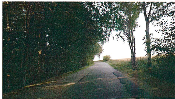
Ausgebesserte von Schadstellen auf der asphaltierten Fahrbahnoberfläche