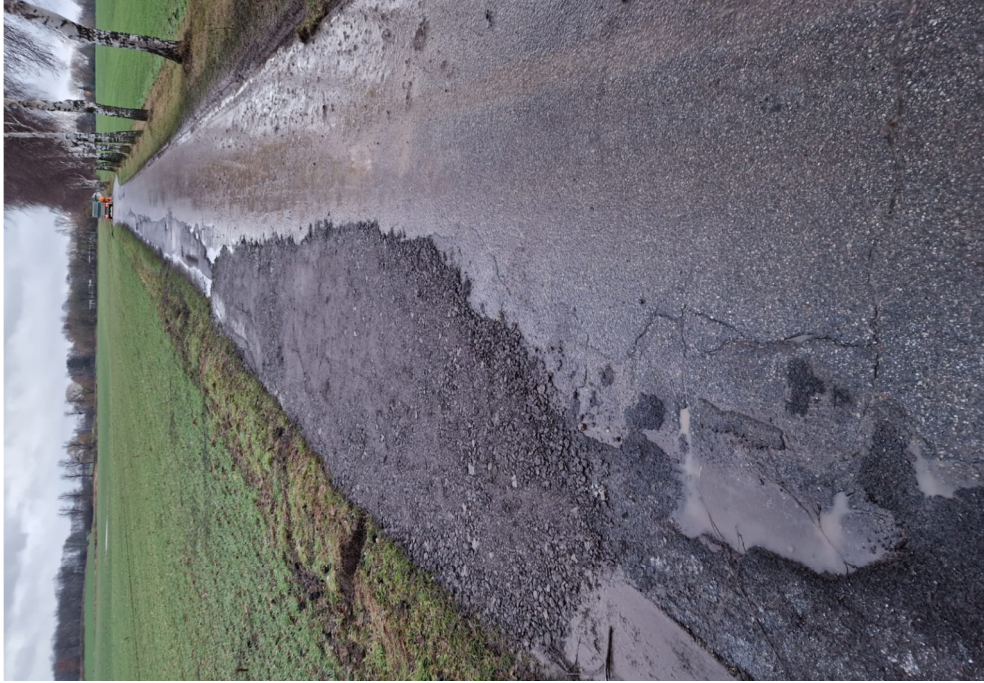
Straße Altenhagen - Parchow Ausbau aufgenommen am 17.01.2023